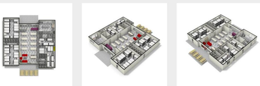
Plattegrond en visualisaties